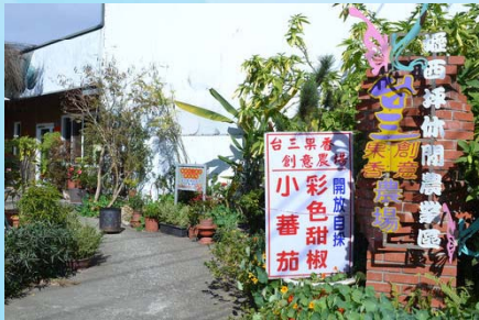
台三菓香創意農場