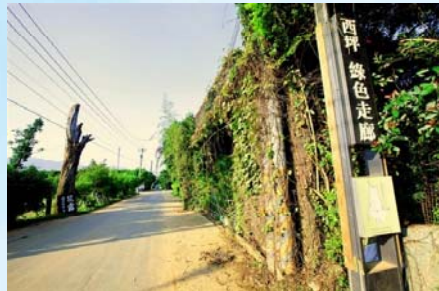
西坪花藝自行車道