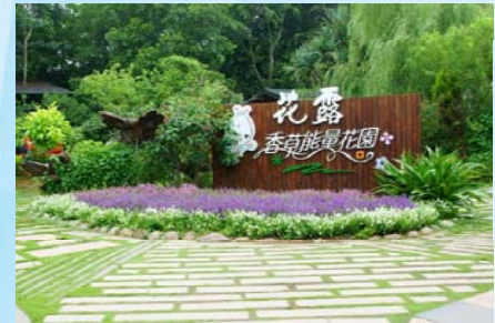
花露花卉休閒農場