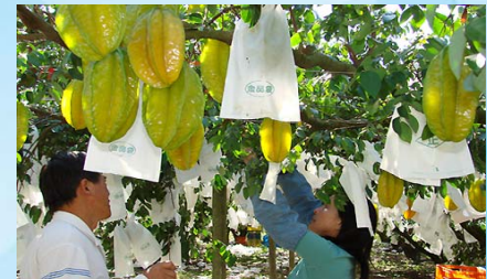
白布帆阿花姐農場