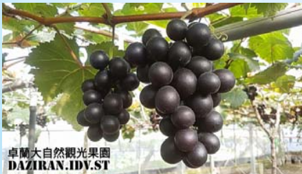
大自然觀光果園農場